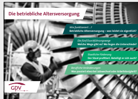
Die betriebliche Altersversorgung