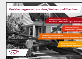
Versicherungen rund um Haus, Wohnen und Eigentum