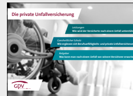
Die private Unfallversicherung