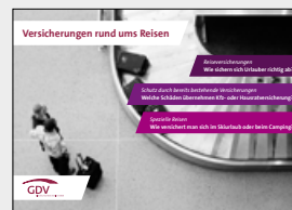
Versicherungen rund ums Reisen