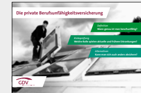
Die private Berufsunfähigkeitsversicherung