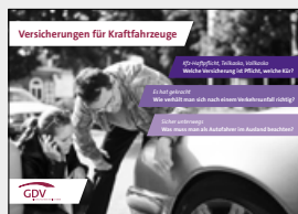
Versicherungen für Kraftfahrzeuge