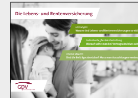
Die Lebens- und Rentenversicherung