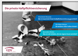
Die private Haftpflichtversicherung